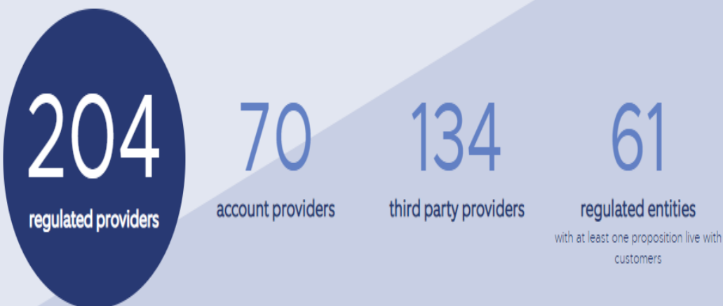
Open Banking Providers in 2019